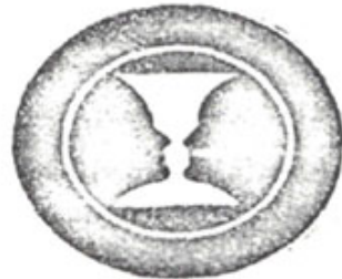
Figura 1.5. La copa de Rubi o figuras ambiguas.

En esta figura -o en cualquier otra- ambigua, una vez que uno ha visto una de las figuras -ya sea la copa o las caras-, resulta difícil ver la contraria. Sólo cuando se sabe que las dos están dentro del círculo se puede pasar a ver una u figura, alternativamente, puesto que tampoco se pueden ver las dos a la vez.